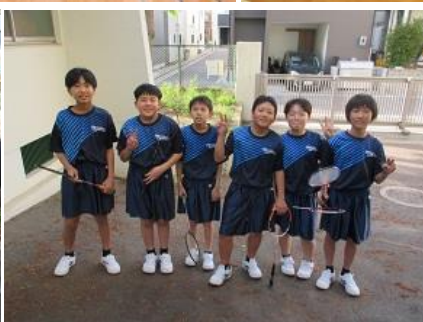
⑥今日の部活動仮入部は、まず 体育館方面に行きました。 男子バドミントン部は、体育館 の外側でも活動していました。