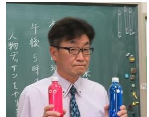
↑毎年、ペットボトルを両手に・・・