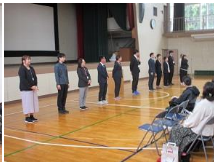
←みんなで 並んで、 自己紹介