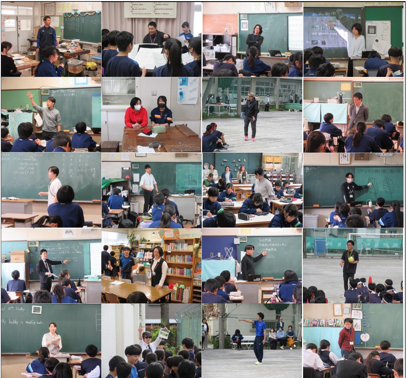
⑤そして、2年生と10組の保護者会がありました。↓