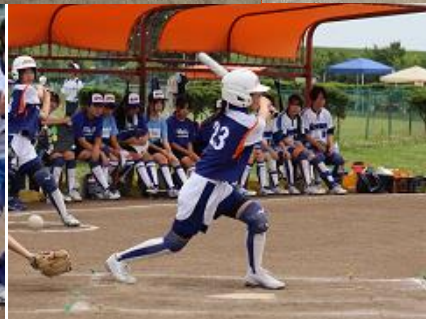
②荒川総合運動公園にて、ソフトボール部の大会がありました。1回戦はコールドゲームで勝利でした。みんな大活躍できてよかったね！