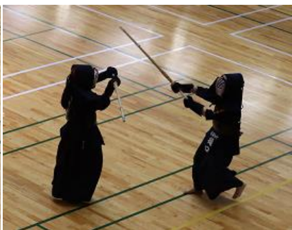
④大宮武道館にて、剣道女子部の団体戦がありました。1回戦惜敗でしたが、少ない部員数で最後までよく頑張りましたね。また、個人戦は3年生1名が、次のステージに進出しました。