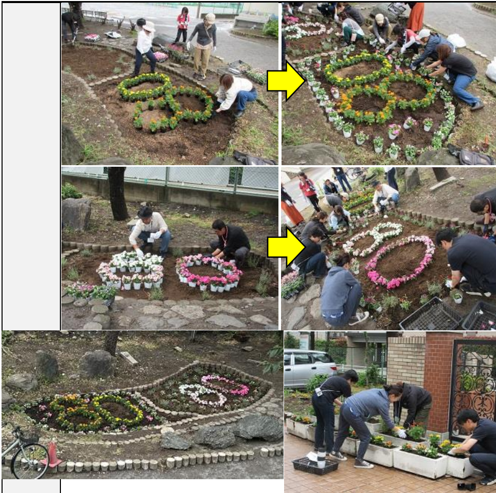
④本日、PTA 主催の「ガーデニング」があり、本部役員・ボランティアの方々と一緒に、校内に花を植えました。開校80周年記念を意識して、「80」の文字を描きました。