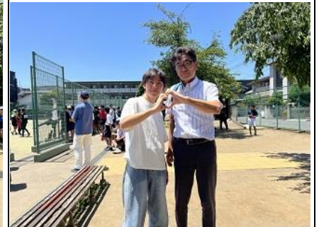
↑ 卒業生も応援に・・・