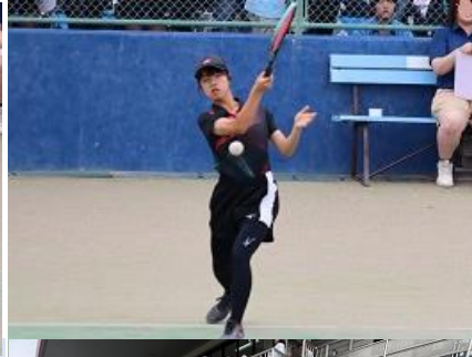
*** 学校総合体育大会2日目です。 ①天沼テニスコートにて、女子テニス部の個人戦の続きがありました。3ペアとも惜敗でしたが、みんなよく頑張りました。