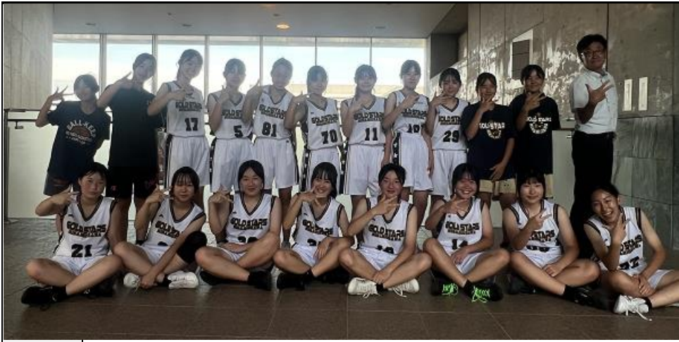
◎サッカー部は2回戦（シードなので大会は1試合目ですが）突破しました！