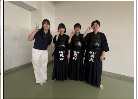
↑ 卒業生も応援に・・・